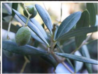
↓ Olive / Olivo