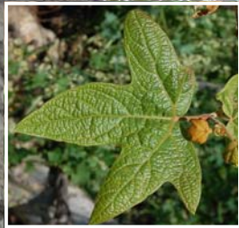
Sycamore / Sicomoro ↑