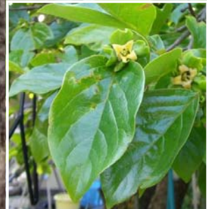
Persimmon / Caqui ↑