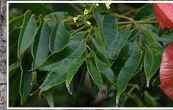
Goldenrain tree / Goldenrain ↑